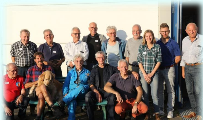
De Hout cursisten in 2018