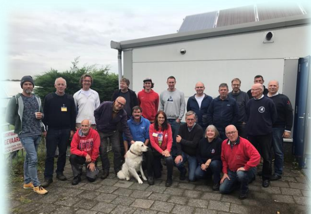
De Hout cursisten in 2021